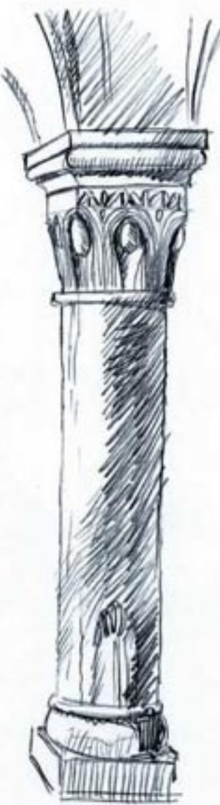
Capitel del monasterio de Santa María de Huerta.