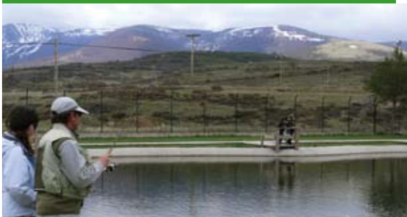
Pineda de la Sierra

Estas instalaciones están abiertas a toda la población, niños, jóvenes y adultos y a los colectivos de pescadores que se inician en esta afición, en particular.